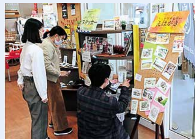
▲写真5 新しい店頭ディスプレイ

と面白さを学んだはず。皆様がこの原稿をお読みになる頃には、「まちバル」(まちなか太平洋線通り・若桜通り交差点角)の店頭にて、この「とっとりメモリー」ステッカーシリーズが、新たな独自の店頭ディスプレイの中で、絵はがきシリーズなどと並んで展開されているはず。ぜひ実際にお手に取り、その魅力を実感していただければ幸いです。