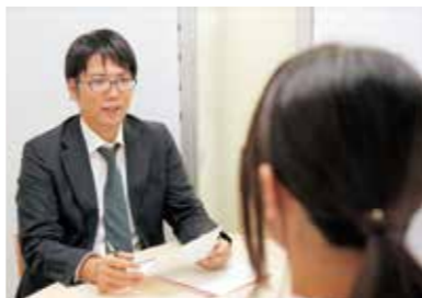
現在はマスク着用、パーティション設置など感染症対策を講じて面談をおこなっています。

3月から就職活動が本格化する3年生の就職活動への意識を高めるため、夏・冬期の2回面談を行いました。夏はジョブカードから自己分析、就活準備状況を確認、冬は志望企業の確認やエントリーシートの添削などを行いました。