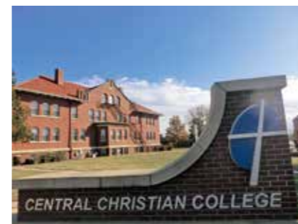
▲セントラルクリスチャンカレッジオブカンザス (アメリカ)

今後、学生交流と異文化体験を主とした相互派遣方式のプログラムを実施していく予定です。本学の派遣プログラムでは正規科目の英語、その他科目の履修、学生寮滞在など学生同士の交流を極力多く含んだプログラム内容で、単位取得を目指すものとなります。