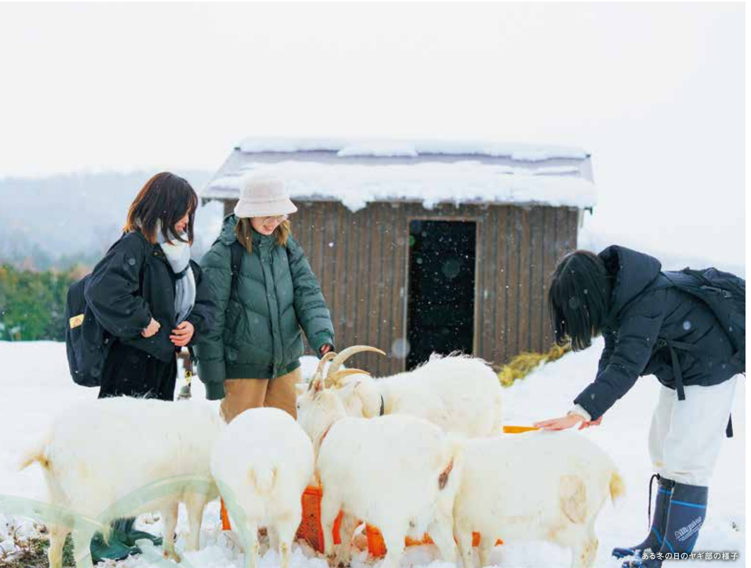
ある冬の日のヤギ部の様子