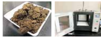
▲ 下水汚泥 ▲ マイクロ波照射装置

下水道と聞くと、「臭い」「汚い」などのイメージを抱く人が多いかと思いますが、下水道は都市で大量に発生する汚れた水を処理するという重要な役割を担っています。下水汚泥はその下水処理の過程で発生するのですが、「安定的に」「大量に」「均質に」発生することから有用なバイオマス資源として、近年注目を集めています。