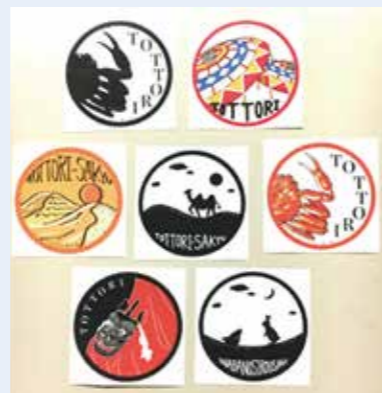
▲写真4 ステッカーデザイン最終案