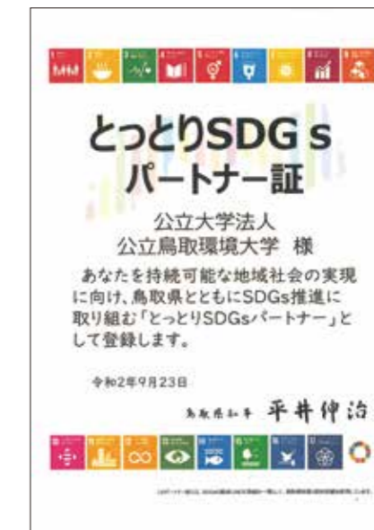
▲とっとりSDGsパートナー証

この度、本学は持続可能な地域社会の実現に向け、鳥取県とともにSDGs推進に取り組む「とっとりSDGsパートナー」に登録し、鳥取県発行のパートナー証を受け取りました。