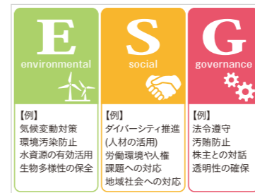
▲ 企業のESG情報開示とは?

ESG情報はその特性として、財務情報よりはるかに定性的な情報が多く、その情報を評価する内容は多様となる。そのため、これまで人が評価している内容をAI技術の一手法であるディープラーニング(深層学習)を利用し、評価することが重要となり、すでに商業ベースで活用されている。