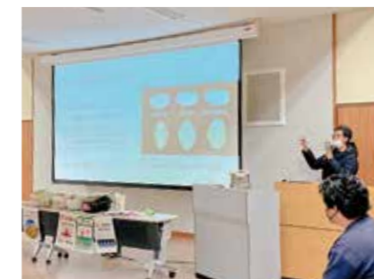
▲コメの品質に影響する地球温暖化について解説

参加した学生からは「ご飯の食べ比べによって品種の違いが分かり、興味深かった。」「世界の米とSDGsとの関連性について興味が湧いた。」という意見がありました。