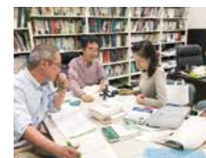
▲ 共同研究 打ち合わせの様子

本研究ではAI技術を利用したESG情報との融合に着目し、ESG情報開示が実際のESG評価にどのように影響し、ステークホルダーへの印象を良くするためだけに開示されていないかどうかを判定するモデルを構築している。具体的には、経営者の発言するESG情報の内容を判定するモデルやESG情報に掲載されている写真を自動取得し、それらの使用傾向を明らかにする解析を行っている。