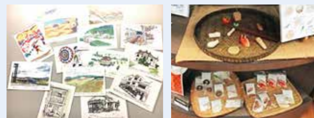
▲写真1 とっとりメモリー 絵はがきシリーズ展開 ▲写真2 とっとりメモリー はし置きシリーズ

公立鳥取環境大学磯野ゼミでは、2016年よりゼミ独自の鳥取のお土産イラストブランド「とっとりメモリー」を企画・販売しています。これまでにこのブランドから絵はがきシリーズ、箸置きシリーズを展開し、いずれも好評を博し、これまでに多くの観光客や地元の方にご購入いただきました(写真1、2)。今年度である2020年度は、1-2年生が携わるプロジェクト研究によって、このブランドの新たな商品シリーズの開発を試みました。